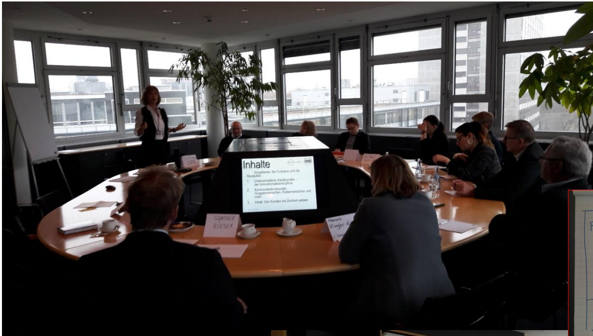
CANVAS Geschäftsmodell, Segmentierung in Business Units